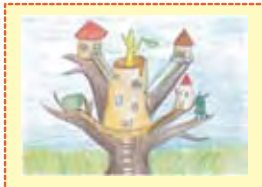
「青空のツリーハウス」